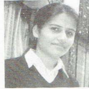
- उषाकला तिमसेना

परिवर्तनको आन्दोलनमा महत्वपूर्ण भूमिका निर्वाह गर्ने नेपाली महिलाहरुमध्ये अगाडी आउने नाम हो, लिला कोइराला । वि.सं. १९९५ मा विराटनगरको जमिन्दार परिवारमा जन्मिएकी लिलाले राजनिती कर्मघर मा आएर सिक्नुभयो । कलिलो उमेरमा उहाँको विवाह भयो । राणाविरोधी आन्दोलनमा लाग्नु भएका सरोज कोइरालासँग २००८ सालमा विहे गरेर मिथिलानगर जनकपुरमा आइपुग्नु भयो । ६० वर्ष अघि उहाँले गरेको विहे कम्युनिष्टहरुले भूमिगत कालमा गर्ने विवाह जस्तै सामान्य रुपमा सम्पन्न भएको थियो । २००४ देखि २००८ सम्म बन्दि जीवन व्यतित गरेर बाहिर निस्कनुभएका सरोज कोइरालाले उतिखेर विवाहका लागि सुरक्षित स्थानका रुपमा बनारस रोज्नु भएको थियो ।